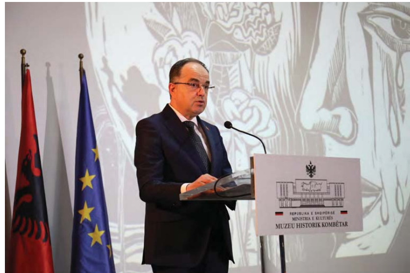
Z. / Mr Bajram Begaj President i Shqipërisë / President of Albania