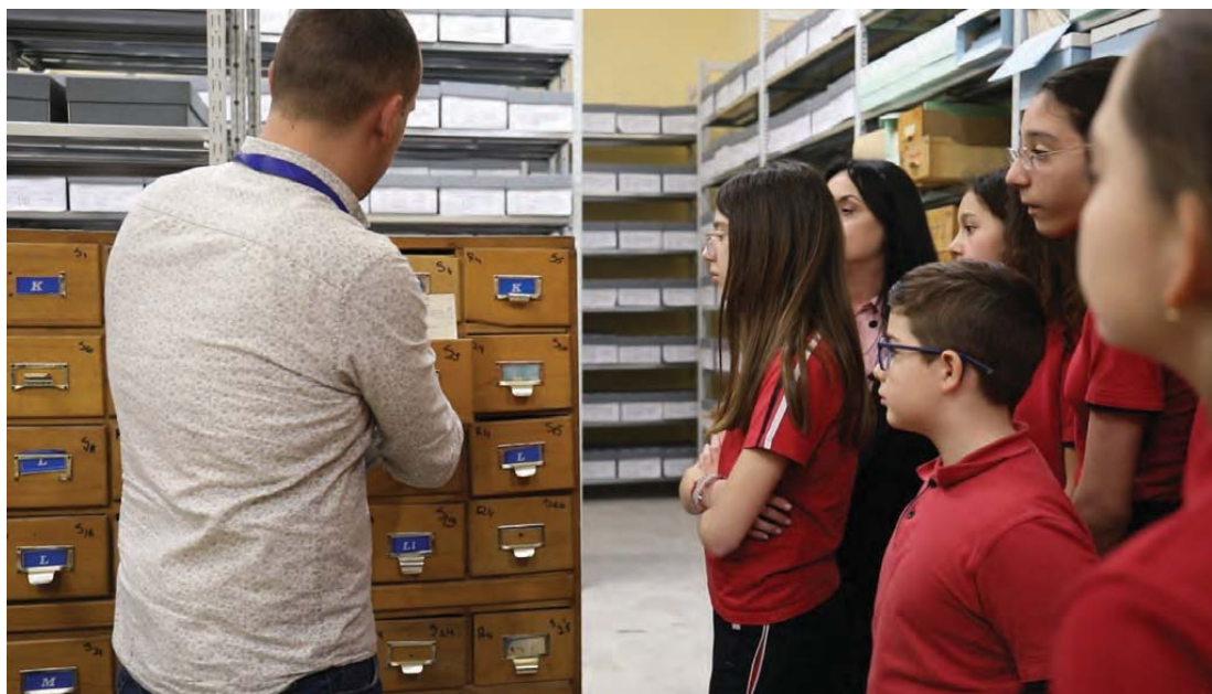
Vizitë në Arkivë / Visit the Archives