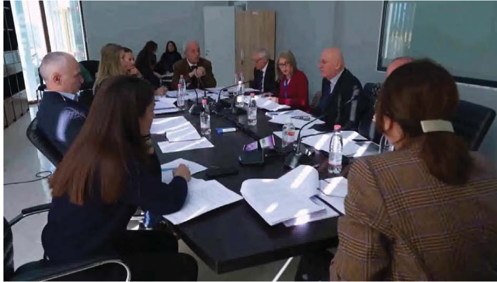
Mbledhje ne Autoritet/Meeting in the Authority