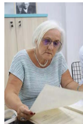
Znj. / Mrs Suzana Gërvalla