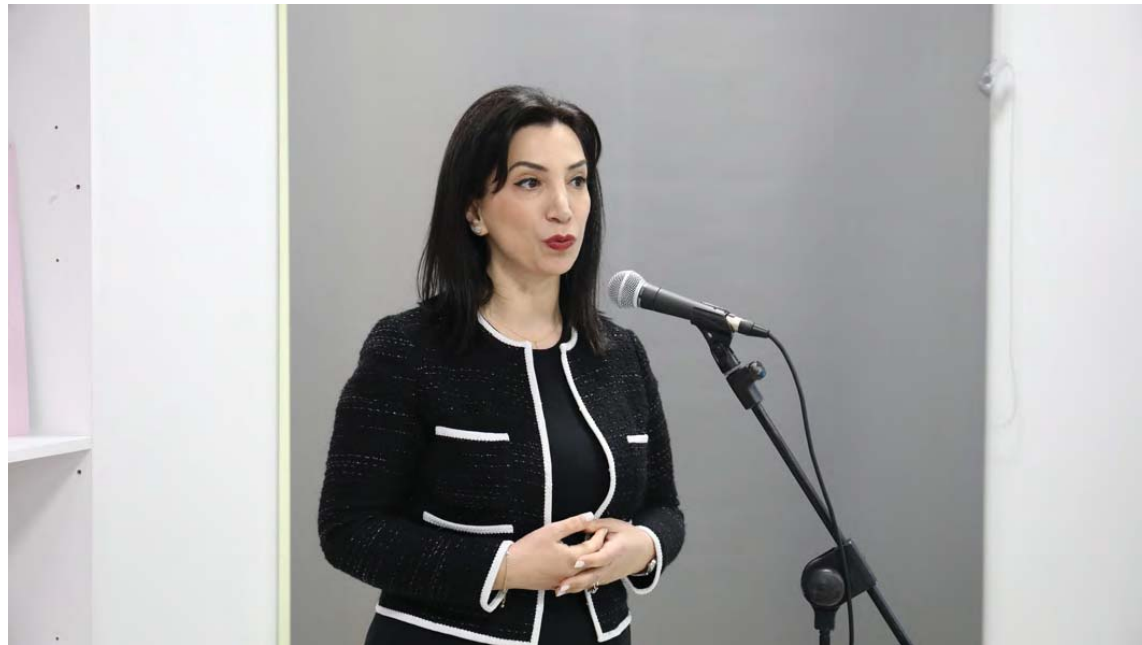
Znj. / Mrs Evis Kushi Ministre e Arsimit / Minister of Education