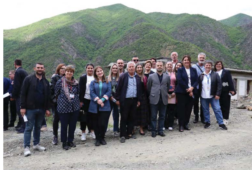
Stafi i Autoritetit / Authority staff