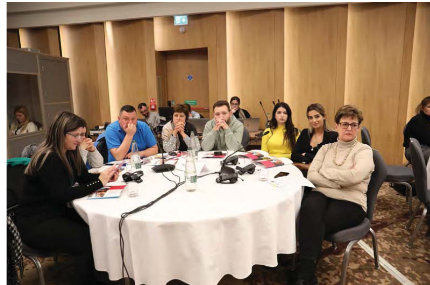
Stafi i Autoritetit / Authority staff