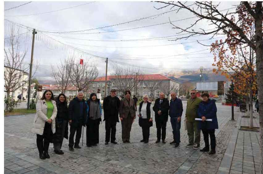
Stafi i Autoritetit / Authority staff