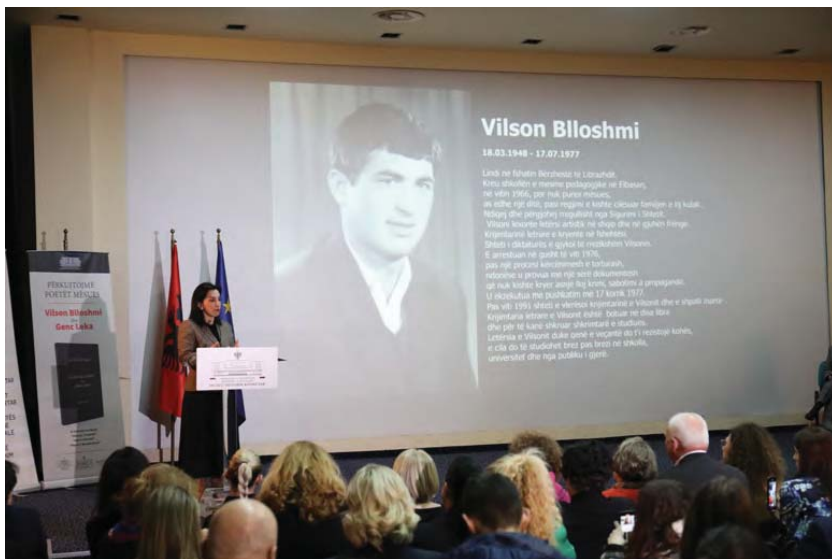
Znj. / Mrs Evis Kushi Ministre e Arsimit / Minister of Education